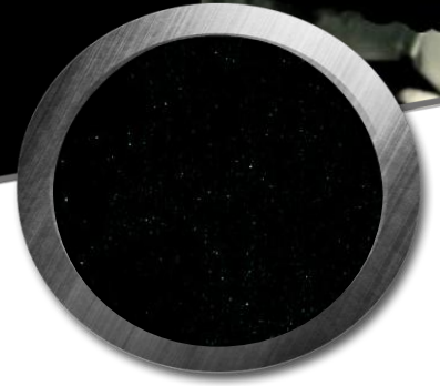
Protection intégrale de la main