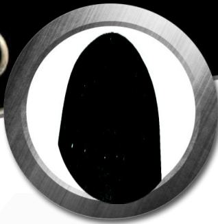
Résistant aux liquides